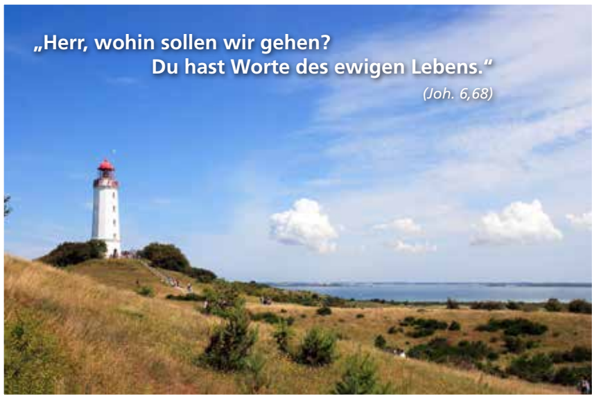
Leuchtturm auf Hiddensee

„Herr, wohin sollen wir gehen? Du hast Worte des ewigen Lebens.“ (Joh. 6,68)