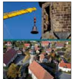
(Cover der DVD von Lausche-Video)

Angekündigt war zudem das Erscheinen einer kleinen Festschrift zu den Waltersdorfer Glocken in Geschichte und Gegenwart mit aufschlussreichen Hintergrundinformationen. Dieser Gedanke konnte aufgrund der vielen Vorhaben in kurzer Zeit noch nicht umgesetzt werden und wartet noch auf eine hoffentlich baldige Ausführung.