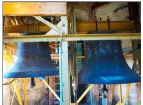
Glocken II und I. unten

sowie vieler Zuwendungen von anderen Waltersdorfern ein gutes Stück näher gekommen.