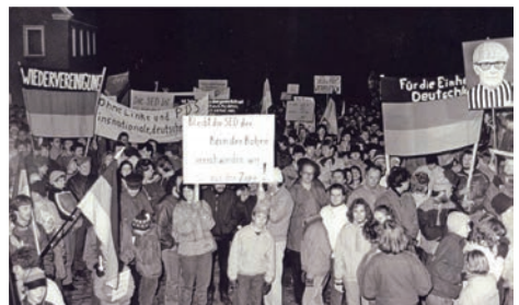
Demonstration am 11.12.1989 in Großschönau

Denn die Friedliche Revolution hat nicht nur in den Städten und Großstädten Sachsens Gestalt gewonnen, sondern ebenso hier bei uns. In der „Chronologie der Wende in Sachsen“ findet sich der Eintrag: „24. September. In der Kir-