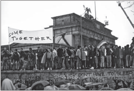
Mauereröffnung am Brandenburger Tor: Am Symbolträchtigsten Ort der Stadt wurde am 22.12.1989 eine Grenzübergangsstelle eröffnet.